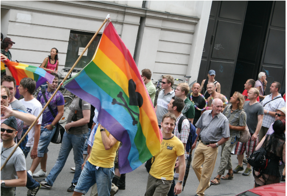
CSD-Parade am Gärtnerplatz