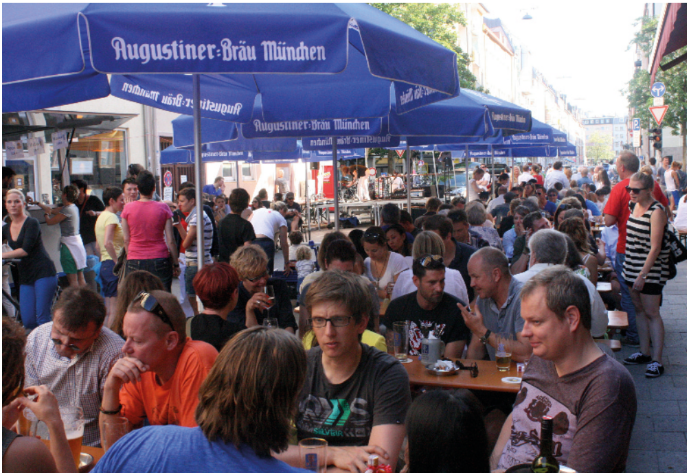
Straßenfest in der Baaderstraße