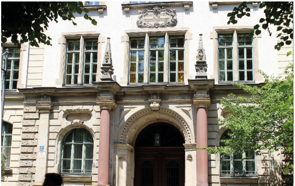
Mittelschule an der Wittelsbacherstraße

Gesamtelternbeirat Gesamtelternbeirat der Volksschulen der Landeshauptstadt München Implerstraße 9, Raum C-2.14, 81371 München Telefon 72 01 55 18 Fax 24 20 92 86 sekretariat@geb.musin.de geb.musin.de/GEB