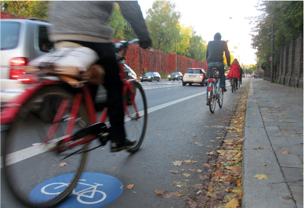
Neue Radstreifen auf der Kapuzinerstraße