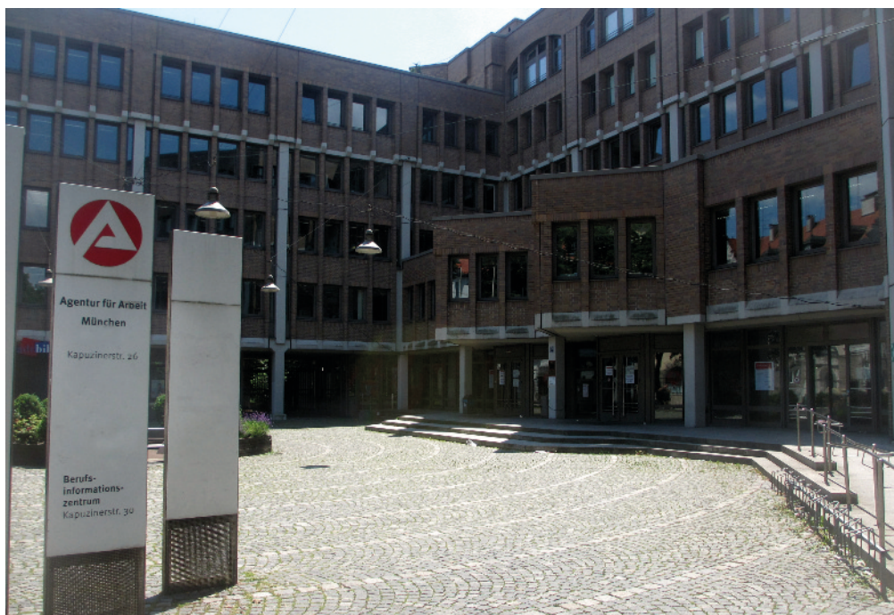
Das Arbeitsamt an der Kapuzinerstraße