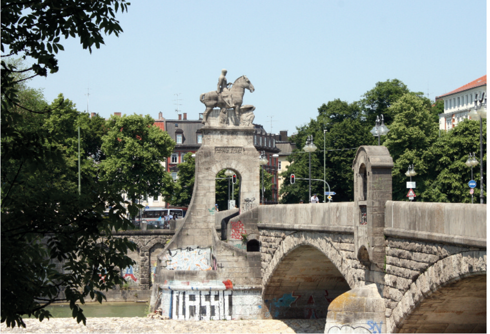
Wittelsbacherbrücke und Baldeplatz