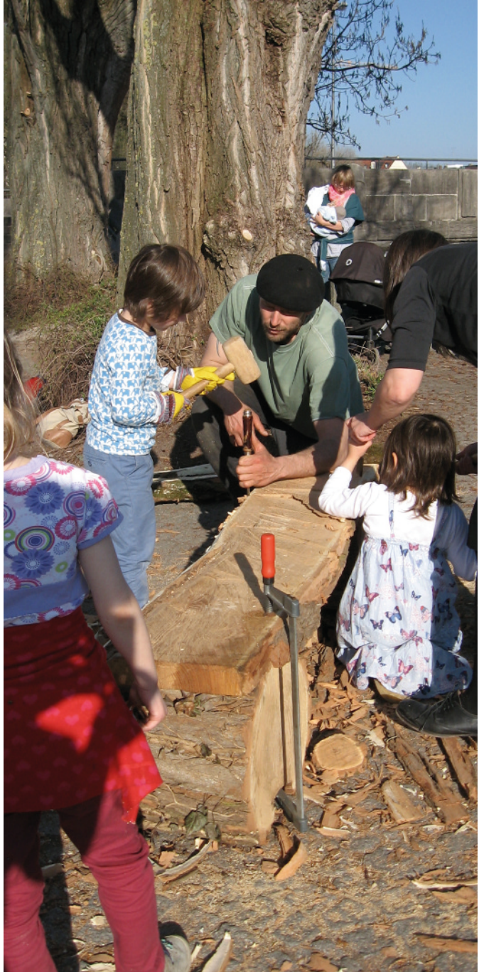
Gartenprojekt Isarbalkon: Kinder basteln, pflanzen und ernten

Maistraße 48, 80337 München Telefon 54 04 38 52 helloaardvark@afterschoolaardvark.com www.afterschoolaardvark.com