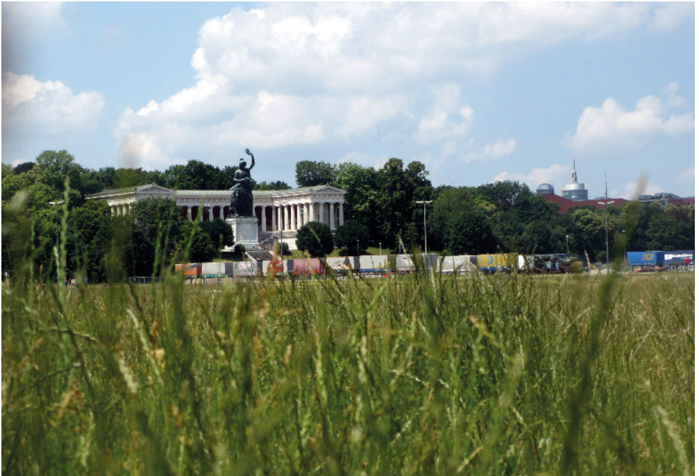
Die Theresienwiese: Wirtschaftsraum oder Naherholungsfläche?