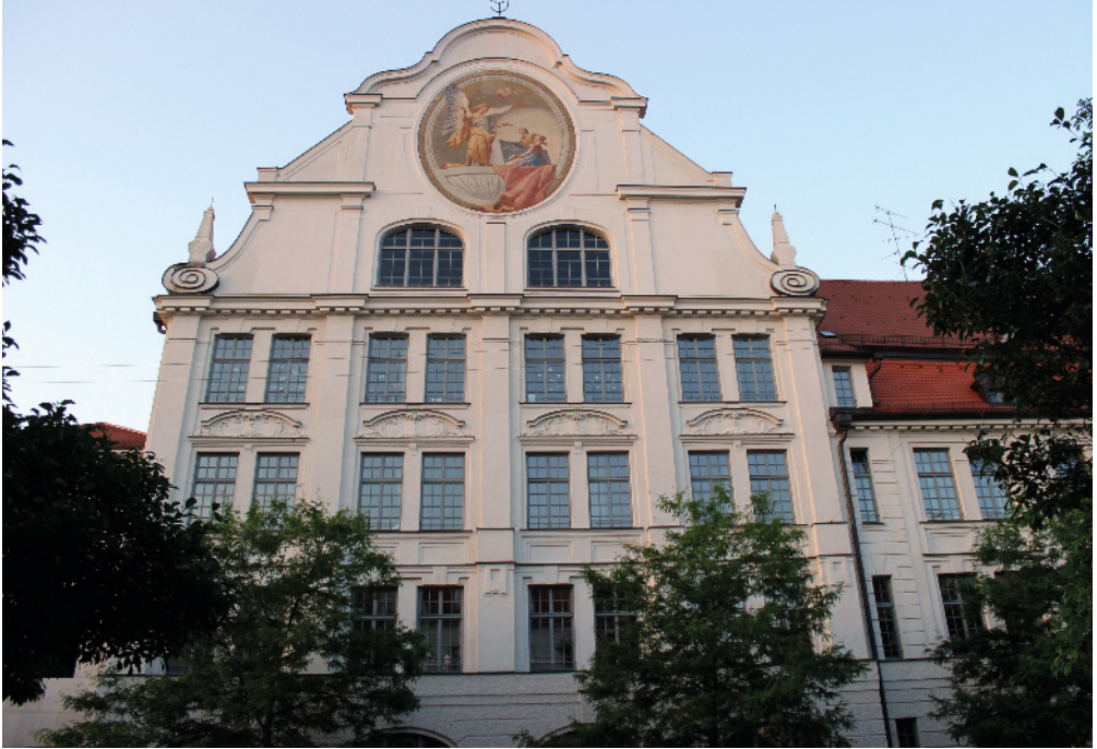
Die Stielerschule wurde 1900 als „schönste und zweckmäßigste Schule der Welt“ ausgezeichnet