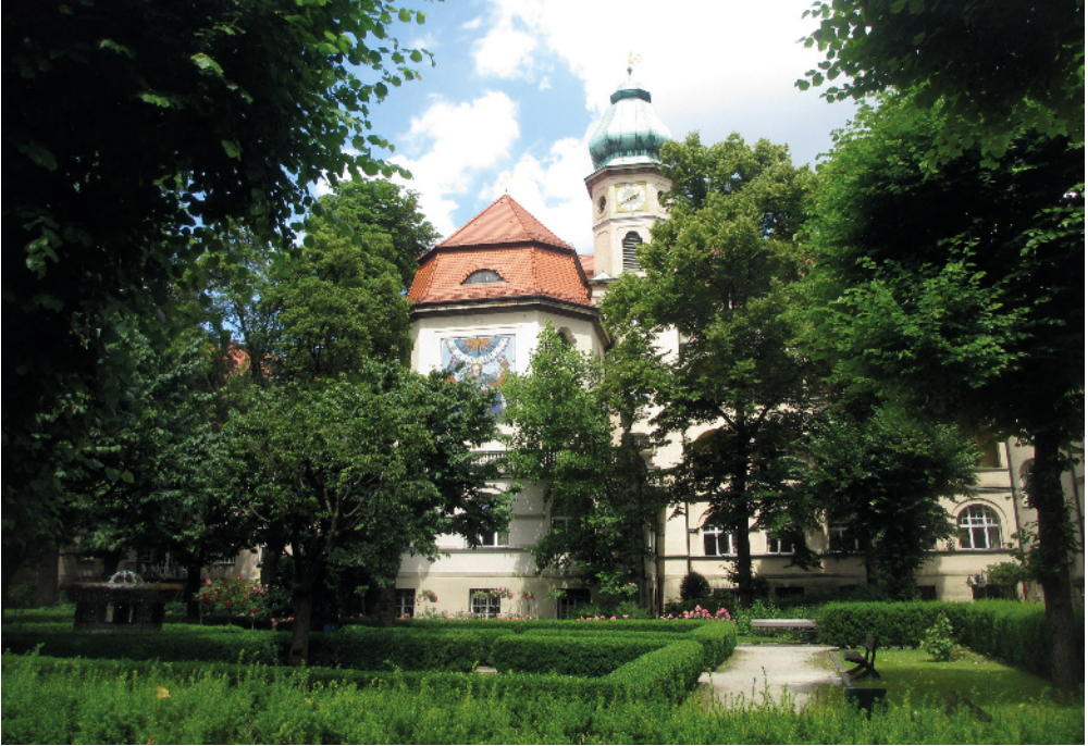
Innenhof der Frauenklinik, Maistraße