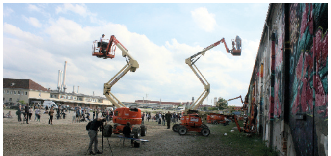
Urban-Art-Festival im Viehhof

Auf dem Gelände findet auch seit 2010 jeden Sommer das Viehhof-Kino mit Nachtbiertgarten statt, bei dem ein abwechslungsreiches Filmprogramm auf einer 16 x 8 m großen Leinwand unter freiem Himmel gezeigt wird.