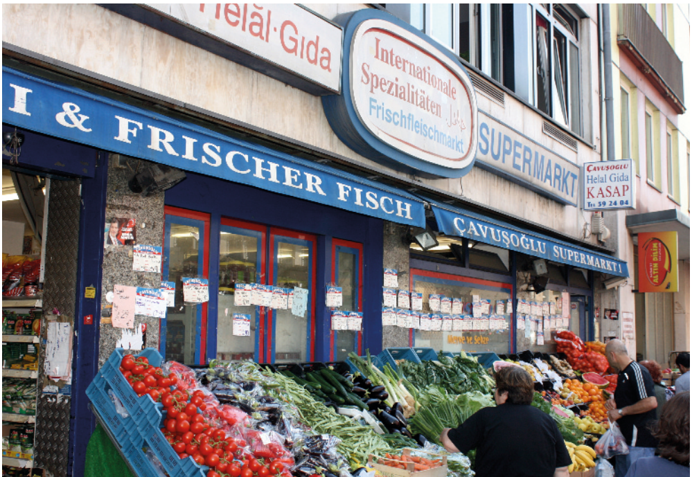
„Klein-Istanbul“ im Südlichen Bahnhofsviertel