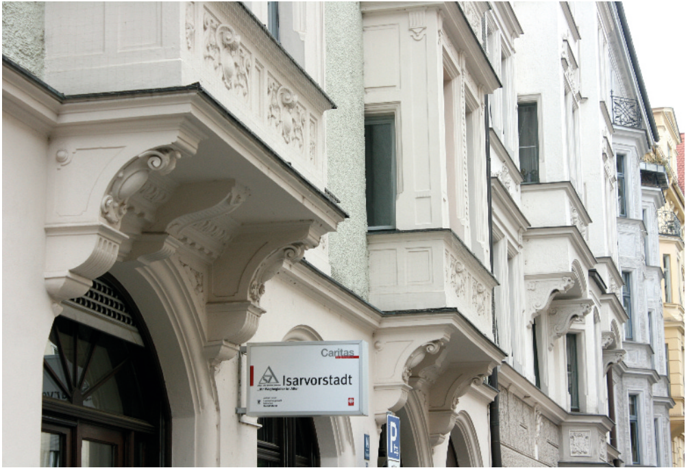
Das ASZ Isarvorstadt in der Hans-Sachs-Straße