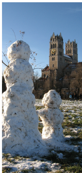
Winter an der Isar

Kapuzinerstraße 10 80337 München Telefon 70 69 82 Fax 45 47 49 39 www.kk-kinderreich.de