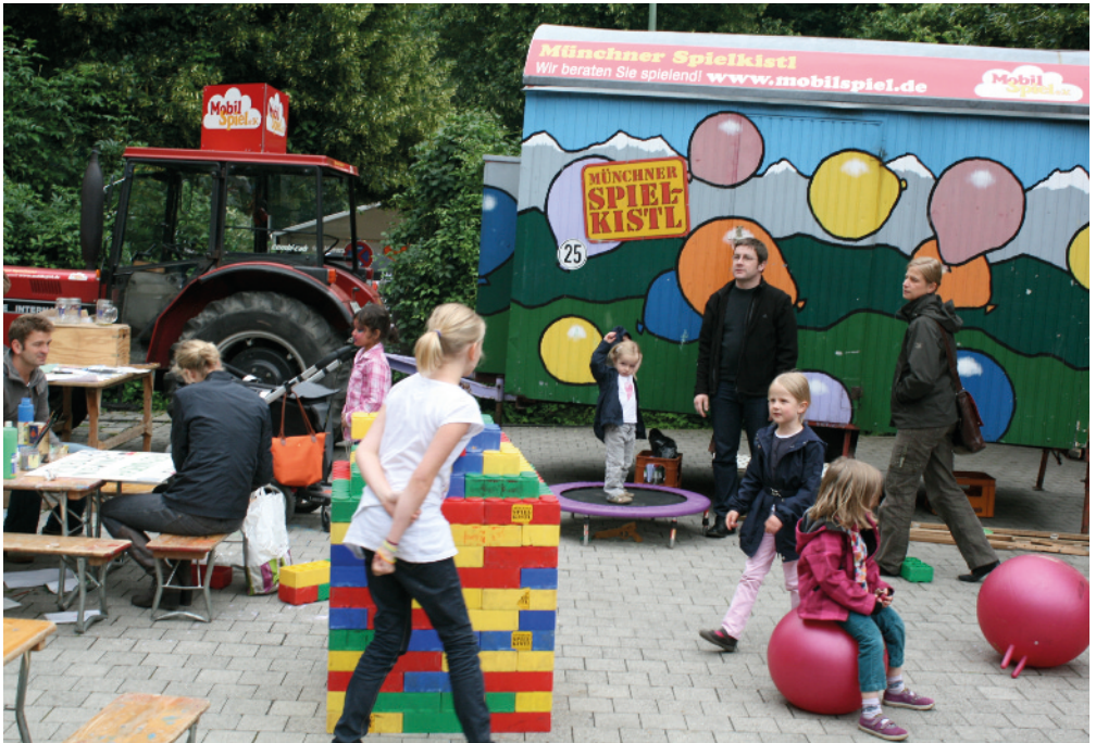
Das Spielkiste! beim Weltkindertag