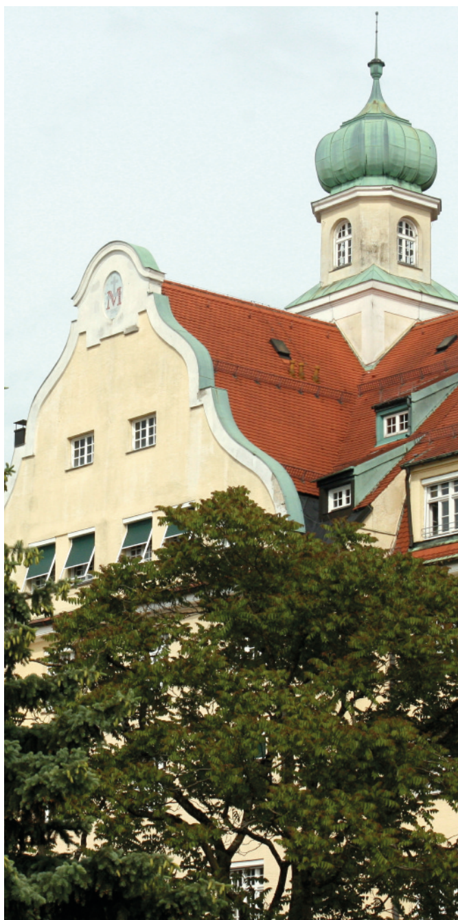
Kreszentia-Stift im Dreimüblenviertel

Seniorenresidenz Klenzestraße 70 80469 München Telefon 2 30 02-0 Fax 2 30 02-100 info@muenchen.tertianum.de www.tertianum-muenchen