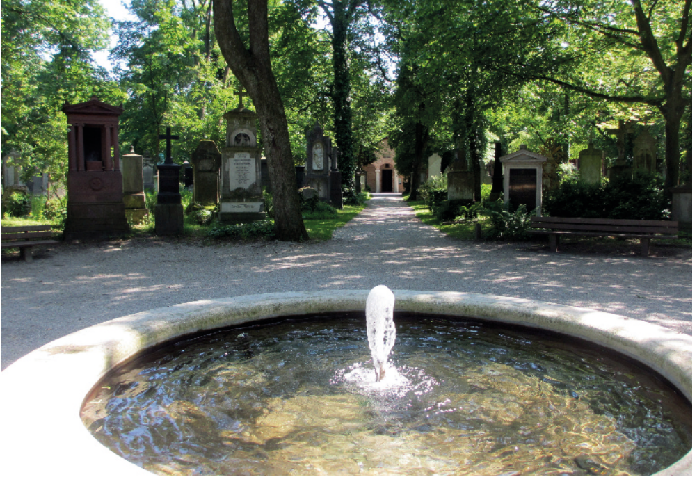
Alter Südlicher Friedhof