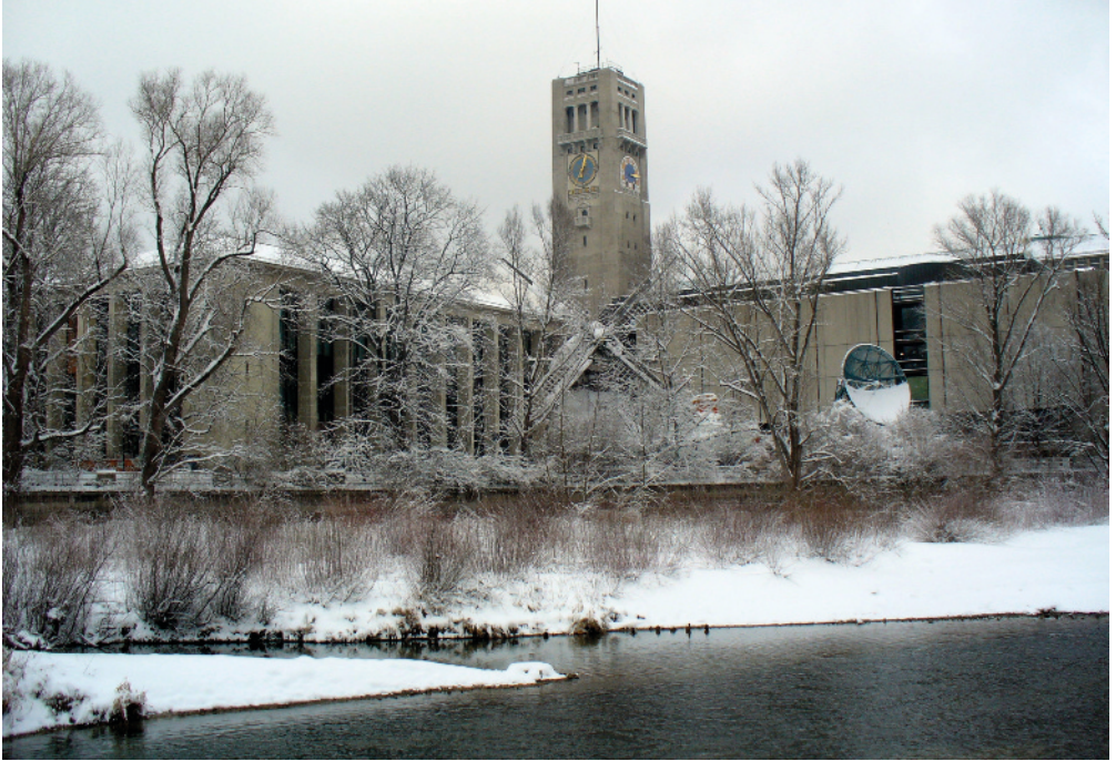
Das Deutsche Museum auf der Isarinsel