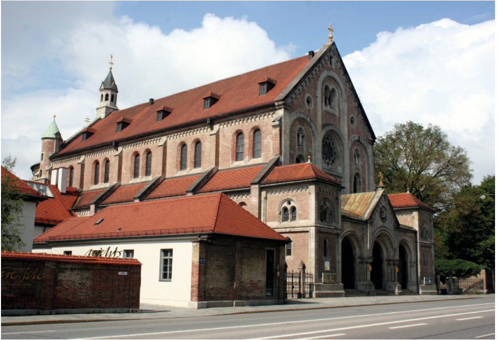
Pfarrrei und Kloster St. Anton an der Kapuzinerstraße