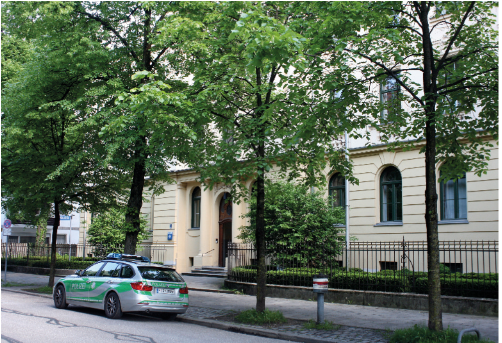
Polizeiinspektion 14, Beethovenstraße 5