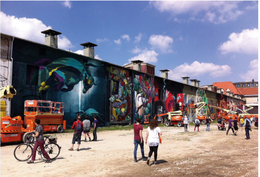
Urban Art im Viehhofgelände