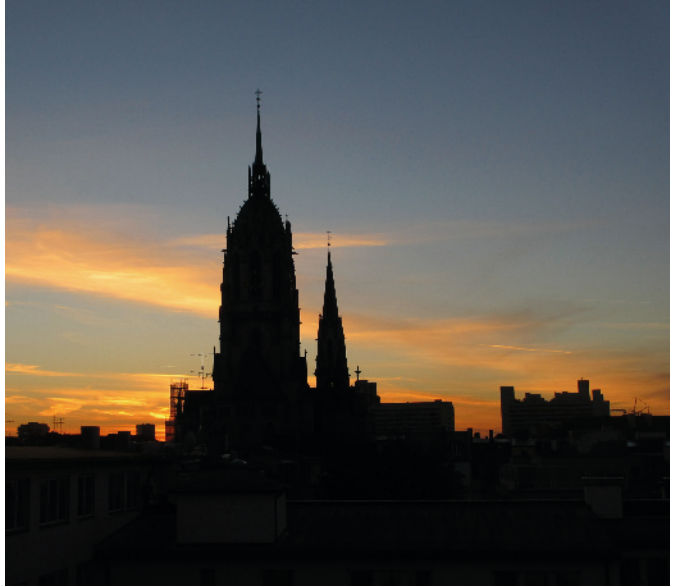
Der Münchner „Vorstadt-Dom“ St. Paul

Das Schlachthof-, Glockenbach- und Gärtnerplatzviertel sind aus gründerzeitlichen Stadterweiterungen hervorgegangene Miethaus- und Gewerbeviertel. Sie verfügen auch heute noch