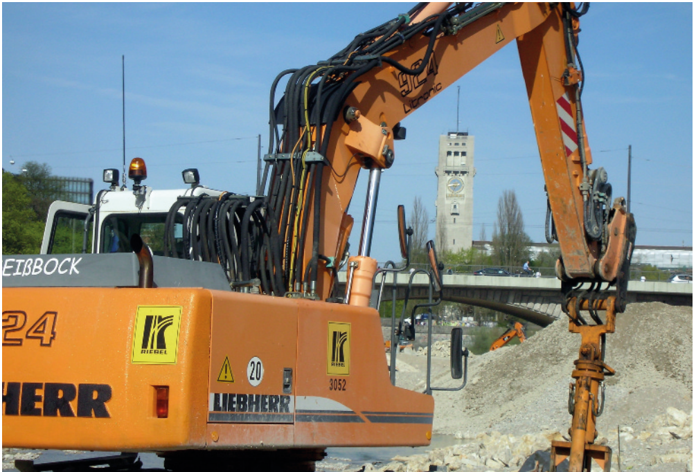
Neues Leben für die Isar: Isarrenaturierung