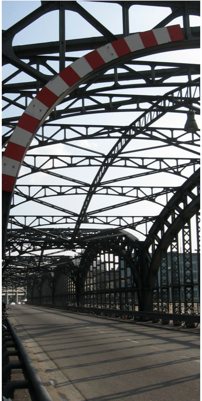
Die Hackerbrücke ist eine der letzten erhaltenen Bogenbrücken aus Schmiedeeisen

Beratungs- und Vernetzungsstelle Münchner AIDS-Hilfe gGmbH Lindwurmstraße 71 80337 München Telefon 54 33 33 09 Fax 54 33 33 33 info@rosa-alter.de www.rosa-alter.de