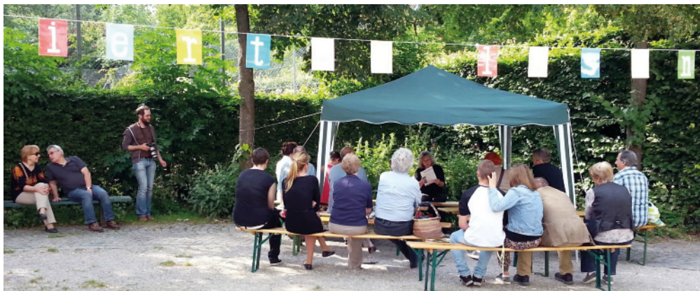
„Viertel-Lesen“ am Karl-Heinrich-Ulrichs-Platz

Goethestraße 30 80336 München Telefon 53 81 92 59