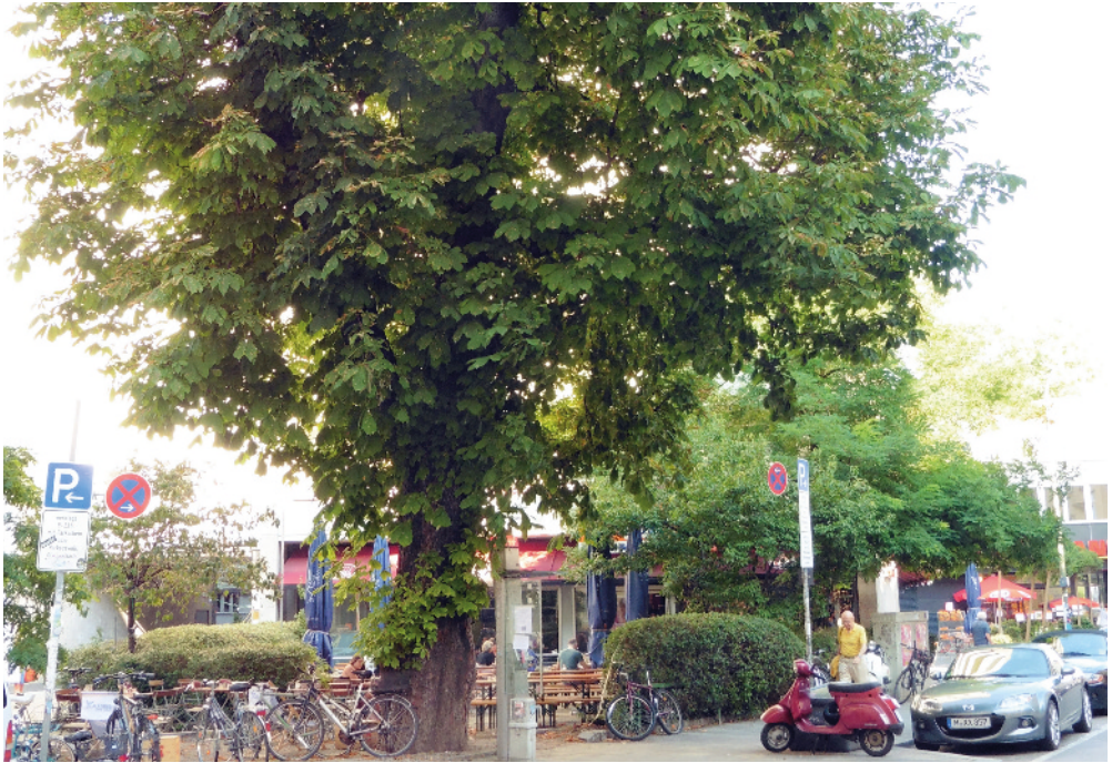
Die alte Kastanie im Kolosseum an der Hans-Sachs-Straße