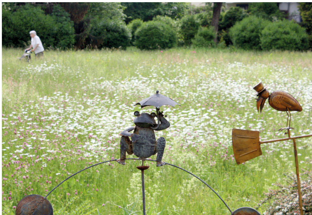
Im Garten vom Kreszentia-Stift