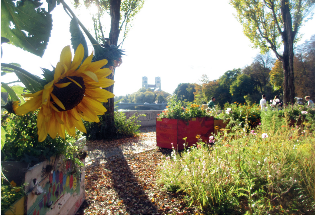
Das Gartenprojekt Isarbalkon auf der Corneliusbrücke

Mit der innerstädtischen Isar-Renaturierung hat der Stadtbezirk an seiner östlichen Grenze ein attraktives, grundlegend neu gestaltetes, quartiernahe Naherholungsgebiet erhalten. In einem letzten Akt bekam die Isar unter der Reichenbachbrücke hindurch einen neuen Seitenarm. Im Jahr 2011 wurde das Großprojekt Isar-Plan nach über elfjähriger Bauzeit abgeschlossen.