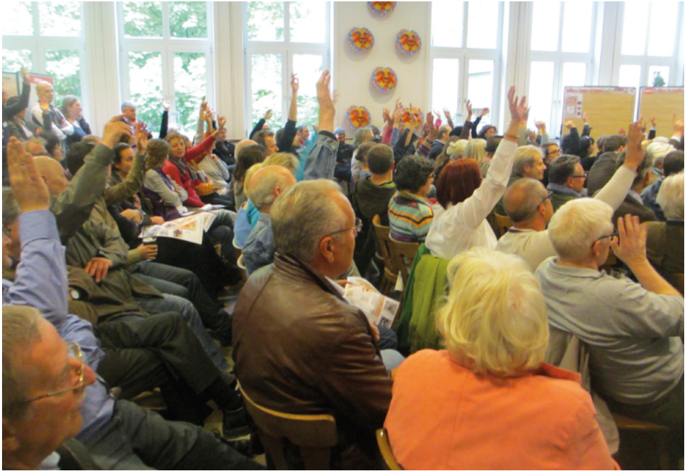
Ideen-Werkstatt „Zukunft Viehhof“