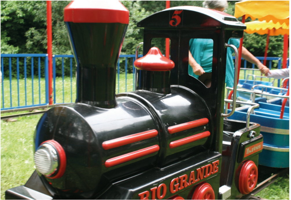
Stadtteilfest Am Glockenbach