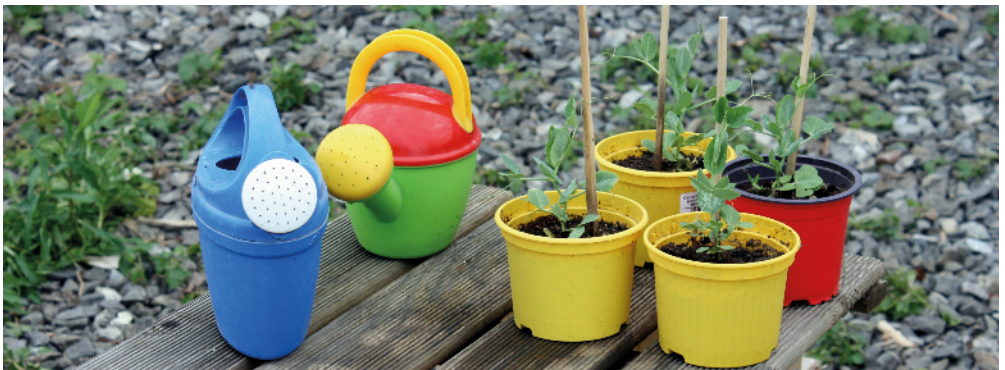
Südgarten im Viehhof

Landeshauptstadt München Bayerstraße 28a 80335 München Telefon 233-4 78 71 Fax 233-4 78 72 schwangerenberatung.rgu @muenchen.de,