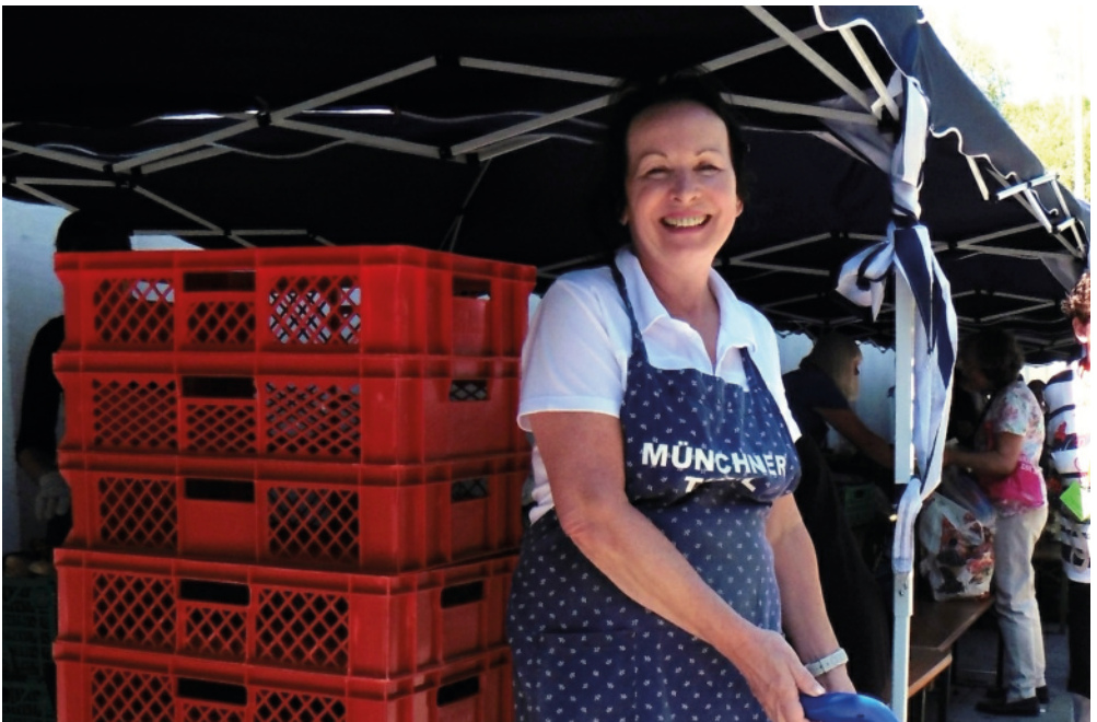
Lebensmittel für Menschen in Armut: Die Münchner Tafel

Schäftlarnstr. 10, 81371 München Städtisches Kontorhaus Zi. 226 Telefon 29 22 50 Fax 29 14 81 info@muenchner-tafel.de www.muenchner-tafel.de