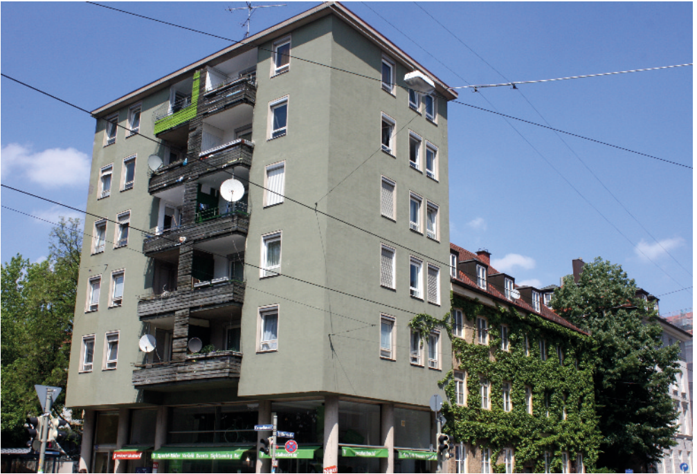
„Bellevue di Monaco“ Müllerstraße 2