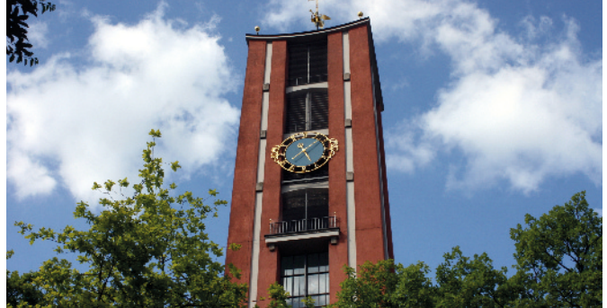
Evangelische Bischofskirche St. Matthäus

St.-Jakobs-Platz 18 80331 München Altstadt-Lehel Telefon 20 24 00-100 Fax 20 24 00-170 info@ikg-m.de www.ikg-muenchen.de