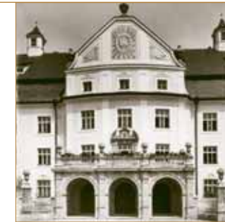
Das Altenheim damals ...

Spätestens im Jahr 2010 wird das Heiliggeistspital wieder bezogen. Wenn ich mich frage, was zu tun ist, um das „neue“ Haus mit dem alten Leben zu füllen, komme ich immer wieder an den Punkt: Feste feiern und eine gute Gesprächskultur sowie gegenseitiges Mitgefühl pflegen.