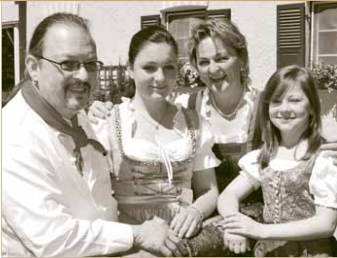
Familie Bary vor der Gaststätte Forsthaus Kasten

„ Acht Prozent der Erlöse aus der Bewirtschaftung gehen an die Heiliggeistspital-Stiftung und kommen damit den Menschen im Heiliggeistspital zugute.“