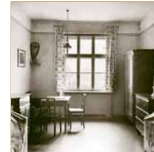
Zimmer für zwei Pfründner

heimbewohner zumeist in Ein- und Zweibettzimmern und nicht mehr nach Geschlechtern getrennt untergebracht, sodass Ehepaare jetzt zusammenleben konnten. Das neue Haus bot Platz für zunächst 616 Pfründner.