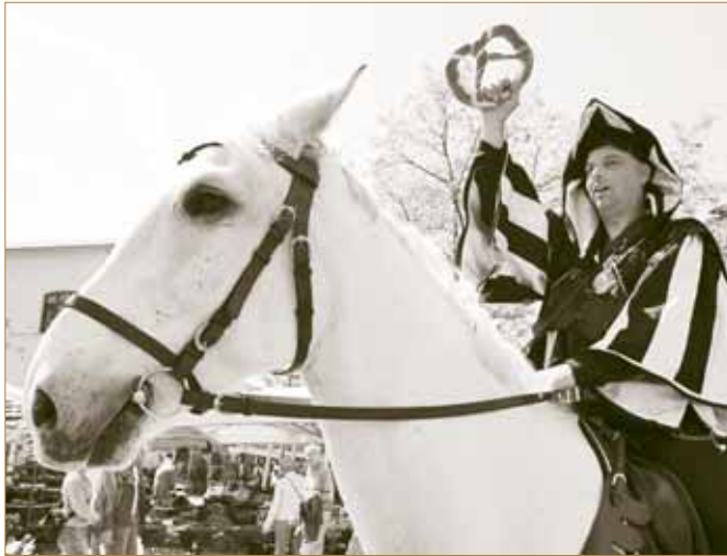
Der Brezenreiter: Beim 850-jährigen Stadtjubiläum Münchens wurde der Brauch der „Wadler-Spende“ wiederbelebt

So schenkte Herzog Otto II. dem Heiliggeistspital zwischen 1250 und 1253 Einkünfte aus dem Isarzoll. Herzog Ludwig II. gewährte ihm 1286 das Braurecht, das bis 1825 ausgeübt wurde. 1376 befreiten die Herzöge Stephan III. und Johann II. das Spital auf ewige Zeiten von allen Steuern und Dienstverpflichtungen und unterstellten es der Rechtsprechung des Münchner Stadtgerichts. Der erste bürgerliche Stifter ist 1274 bezeugt, als der Hutmacher Rapato vor einer Pilgerreise dem Spital für vier Jahre Einkünfte aus seinem Haus zukommen ließ.