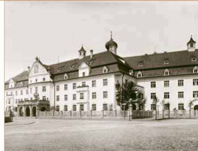
Das Heiliggeistspital am Dom-Pedro-Platz im 20. Jahrhundert

Stiftung. Am 6. Oktober 2005 beschloss der Stadtrat, das Gebäude am Dom-Pedro-Platz grundlegend zu sanieren und bis 2010 zu einem Altenpflegeheim mit 225 Bewohnerplätzen umzubauen.