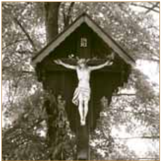
Marterl im Forst Kasten

Kaiser Ludwigs des Bayern, die Betreuung des Heiliggeistspitals wieder auf. Es wurde nun zu einer städtischen Einrichtung, wie es im 14. Jahrhundert auch in vielen anderen Städten üblich war. Beaufsichtigt wurde es von zumeist zwei vom Rat bestellten Hochmeistern; die Leitung lag in den Händen eines Spital- oder Hausmeisters und seiner Frau.