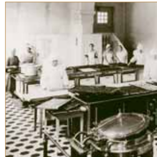
Krankentransport, katholische Anstaltskirche, Anstaltsküche

entwickelte sich ein dreiklassiges System von reichen, mittleren und armen oder gewöhnlichen Pfründen, das über die Versorgung entschied. Seit 1489 wurden die reichen und mittleren Pfründner, die stets in der Minderheit blieben, räumlich getrennt von den armen Pfründnern untergebracht. Letztere waren zu Arbeitsleistungen verpflichtet. Über die gnadenhalber erfolgende Aufnahme völlig Mittelloser entschied der Stadtrat. Die ursprüngliche Aufgabe des Spitals, die Sorge der Gemeinschaft für die Bedürftigen, geriet also nie ganz in Vergessenheit. Arme mit heilbaren Krankheiten wurden jedoch seit 1480 an das Stadtbruderhaus am Kreuz verwiesen.