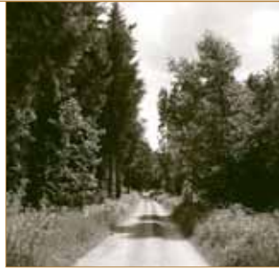
Forst Kasten bildet seit Jahrhunderten eine Grundlage des Stiftungsvermögens