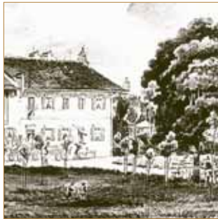
Forsthaus Kasten als Motiv einer Postkarte von 1876

Wir sind schon beinahe 20 Jahre als Pächter im Forsthaus Kasten.