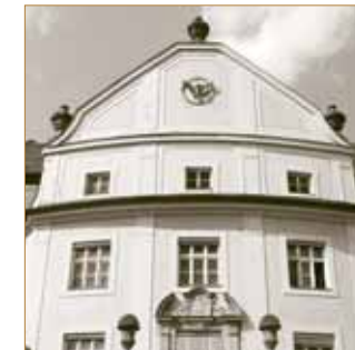
... und heute.

feiern und eine gute Gesprächskultur sowie gegenseitiges Mitgefühl pflegen!“