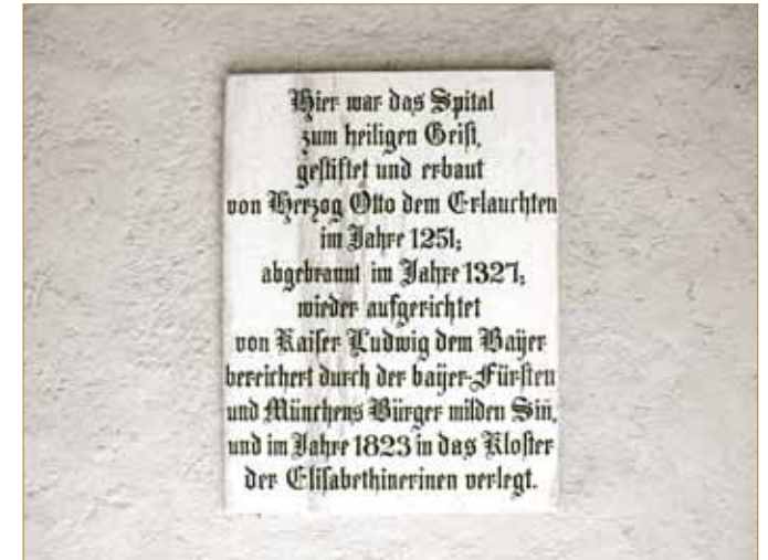
Gedenktafel an der heutigen Heiliggeistkirche im Tal zur Erinnerung an die lange Geschichte des Heiliggeistspitals

Die Geschichte der Heiliggeistspital-Stiftung zeigt eindrucksvoll, dass Vertrauen und Verantwortungsbewusstsein auch über acht Jahrhunderte und darüber hinaus gewahrt und verwirklicht werden können. Darüber bin ich persönlich sehr froh: Denn damals wie heute sollte die Gesellschaft Rahmenbedingungen für ein würdevolles Leben im Alter schaffen. Dieser verantwortungsvolle Umgang mit Seniorinnen und Senioren wird angesichts