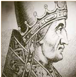
Papst Innozenz IV.

Vermutlich im Jahr 1208, so überliefern es Quellen aus dem 15. Jahrhundert, gründete Herzog Ludwig I. von Bayern vor dem Haupttor im Osten der noch jungen Stadt München ein Spital zur Versorgung von Pilgern, Kranken und bedürftigen Alten. Erstmals belegt wird dieses Spital in einer Urkunde von Papst Innozenz IV. vom 31. Oktober 1250. München war also seit der Marktgründung von 1158 offenbar so rasch gewachsen, dass eine solche Krankenpflege- und Versorgungseinrichtung notwendig geworden war.