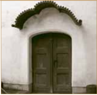
Eingang der Dreifaltigkeitskapelle in Großhesselohle