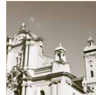
Die Heiliggeistkirche am Viktualienmarkt im Tal damals und heute