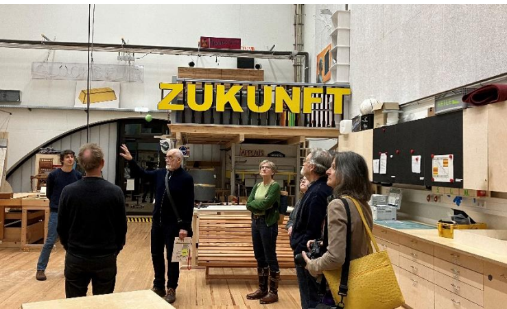
Eindrücke abseits der üblichen Wege: In den Werkstätten des Münchner Volkstheaters

unendlichem Wissen und Herzblut durch das neue Volkstheater. Nach fast zweistündiger fesselnder Führung ließen wir im Schmock, dem im Haus ansässigen Restaurant, das Jahr in geselliger Runde ausklingen.