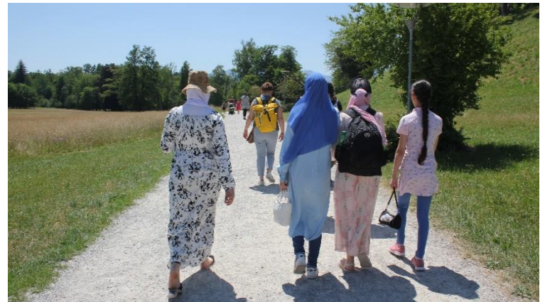
Sommerausflug am Chiemsee

mit gemeinsamem Picknick bekamen wir eine charmante Führung durch das Märchenschloss König Ludwigs II, Herrsching am Chiemsee.