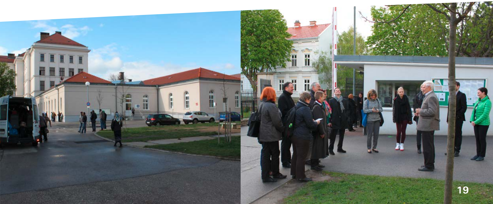
Besuch einer Erstaufnahmeeinrichtung in Traiskirchen/ Österreich

Das Büro für Rückkehrhilfen brachte seine langjährige Erfahrung in das Projekt ein, zwei Mitarbeiterinnen nahmen an Projektreisen nach Finnland, Österreich und Belgien teil. Die Ergebnisse des Projektes fließen in ein „Integriertes Rückkehrmanagement“ ein, das von einer Bund-Länder-Kommission unter Federführung des BAMF entwickelt wird.