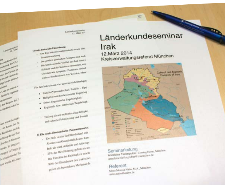
Informationsveranstaltung für Mitarbeiterinnen und Mitarbeiter von Ausländerbehörden

In fünf Landkreisen fanden Informationsveranstaltungen für die zuständigen Landratsämter, Migrationssozialdienste und Ehrenamtlichen-Initiativen statt.