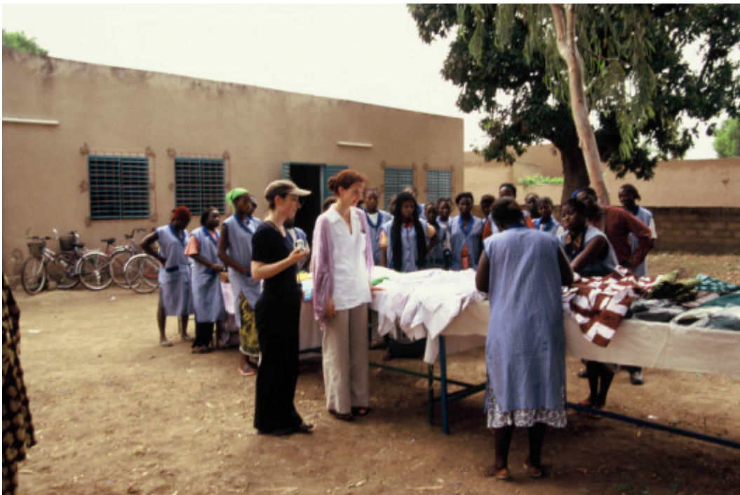
Schneider- und Färbereiklasse der Wend-Raabo Schule bei Ouagadougou

Die Privatschule wurde 1990 gegründet mit dem Ziel, als gemeinnützige Bildungseinrichtung vor allem Waisenkindern und sozialen Härtefällen Unterricht anzubieten. Seither konnten 600 Waisenkinder unterrichtet werden, die in der Regel in den Familien der anderen Schüler untergebracht werden. Die ersten Jahre profitierte sie von einem UN Programm, das Maismehl und Öl für die Bezahlung der Lehrkräfte und zur Schulspeisung zu Verfügung stellte. Nach einer Ausdehnung der Stadtgrenzen von Ouagadougou erfüllte die Schule dann jedoch nicht mehr das Kriterium eines festgelegten Mindestabstandes zur Hauptstadt und fiel aus der UN Förderung heraus. Fortan war sie auf die Unterstützung der Privatinitiative „Schulen für Burkina Faso“ in Deutschland angewiesen. Mit Spendengeldern konnten über die Jahre hinweg sechs Klassenräume, zwei Werkstatträume für Berufsschulklassen, eine Schulküche, ein Büroraum, Toiletten und Lagerräume errichtet werden sowie Lehrkräfte, Schulmaterial, Einrichtung, die Einfriedung des Schulgeländes und Schulspeisung finanziert werden.