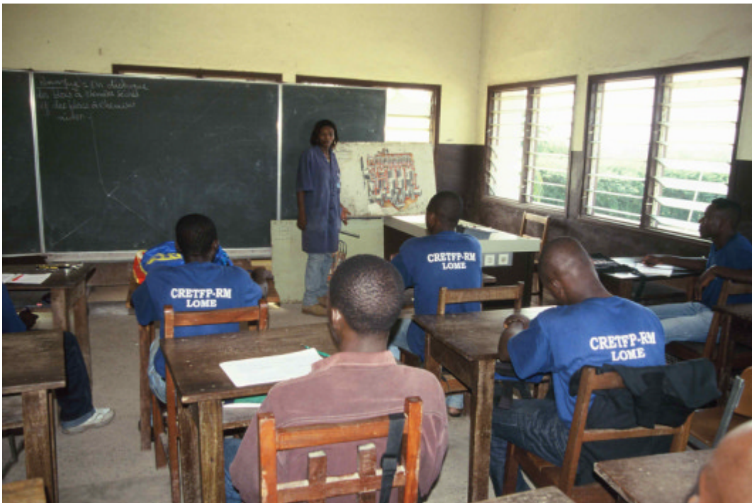
Theorieunterricht in der Klasse für Automechaniker am CRETFP in Lomé