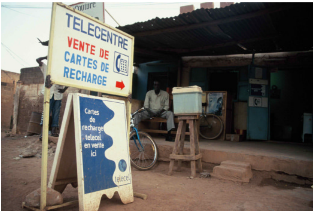
Telecenter in Ouagadougou