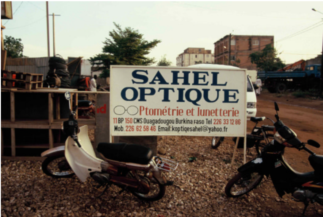
Optikergeschäft in Ouagadougou