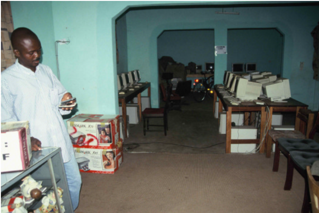
Internetcafé in Lomé