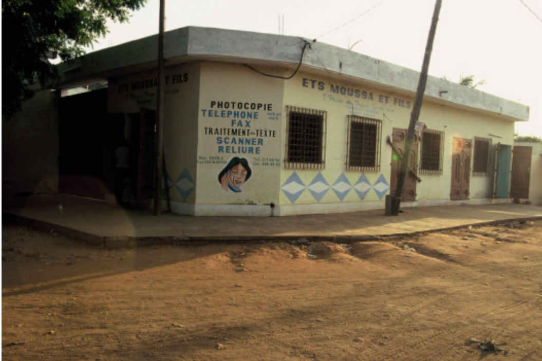
Internetcafe mit zusätzlichem Serviceangebot