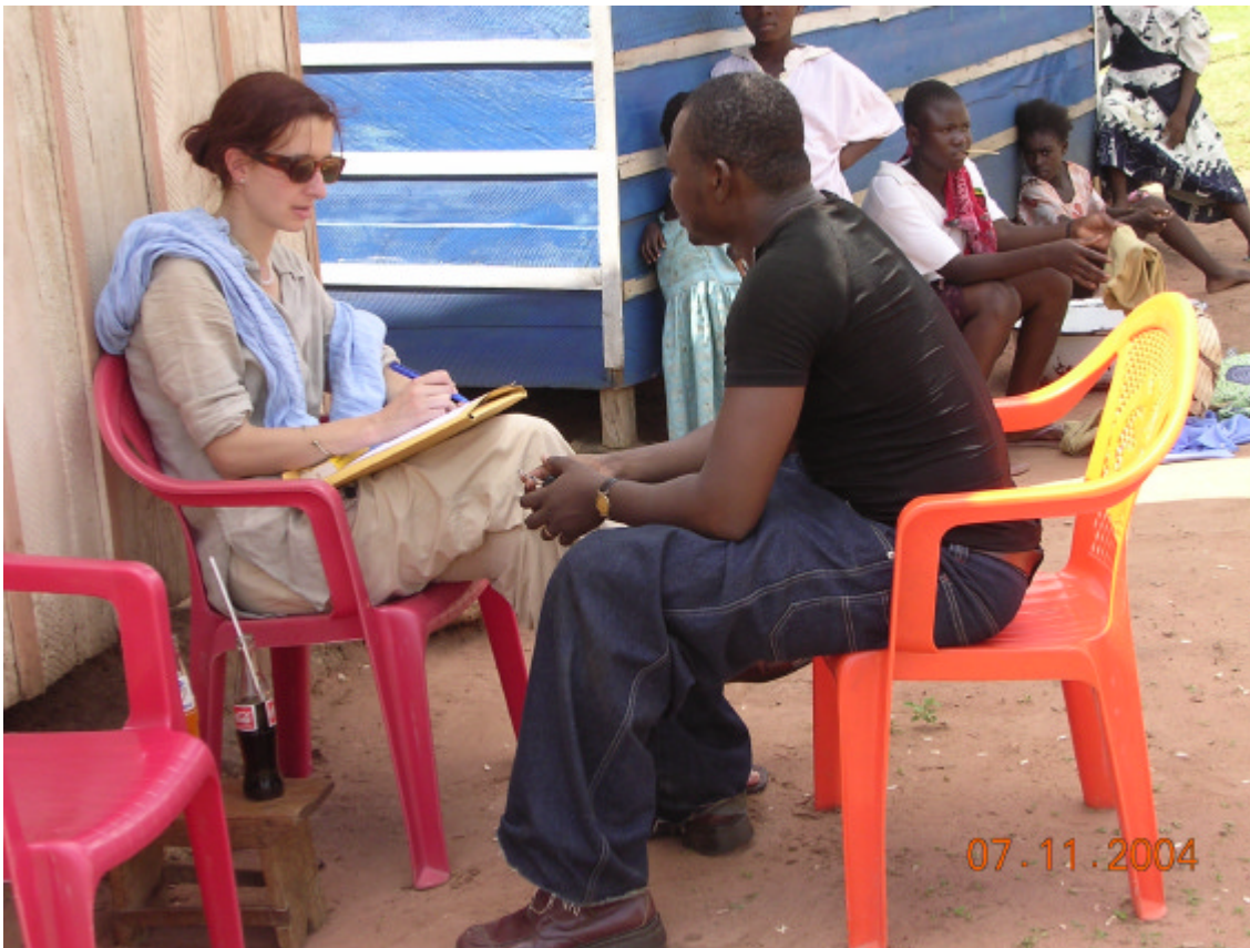
Rückkehrerinterview mit Herrn J. in seinem Dorf Kwame Danso – im Schatten seine Kioskes