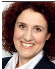
Christine Strobl 2. Bürgermeisterin