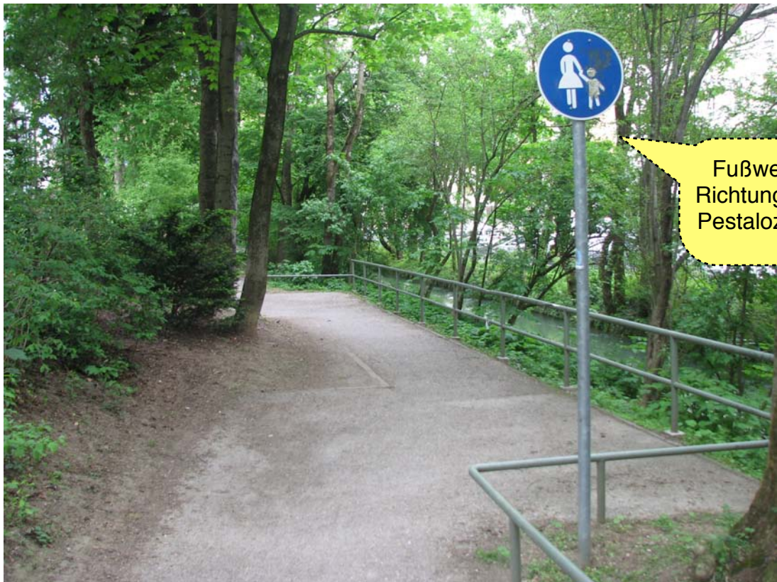
Fußweg Richtung Pestalozzistrasse