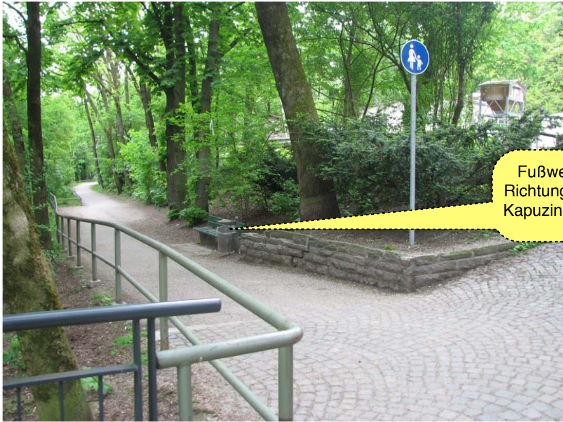
Fußweg Richtung Kapuzinerstrasse